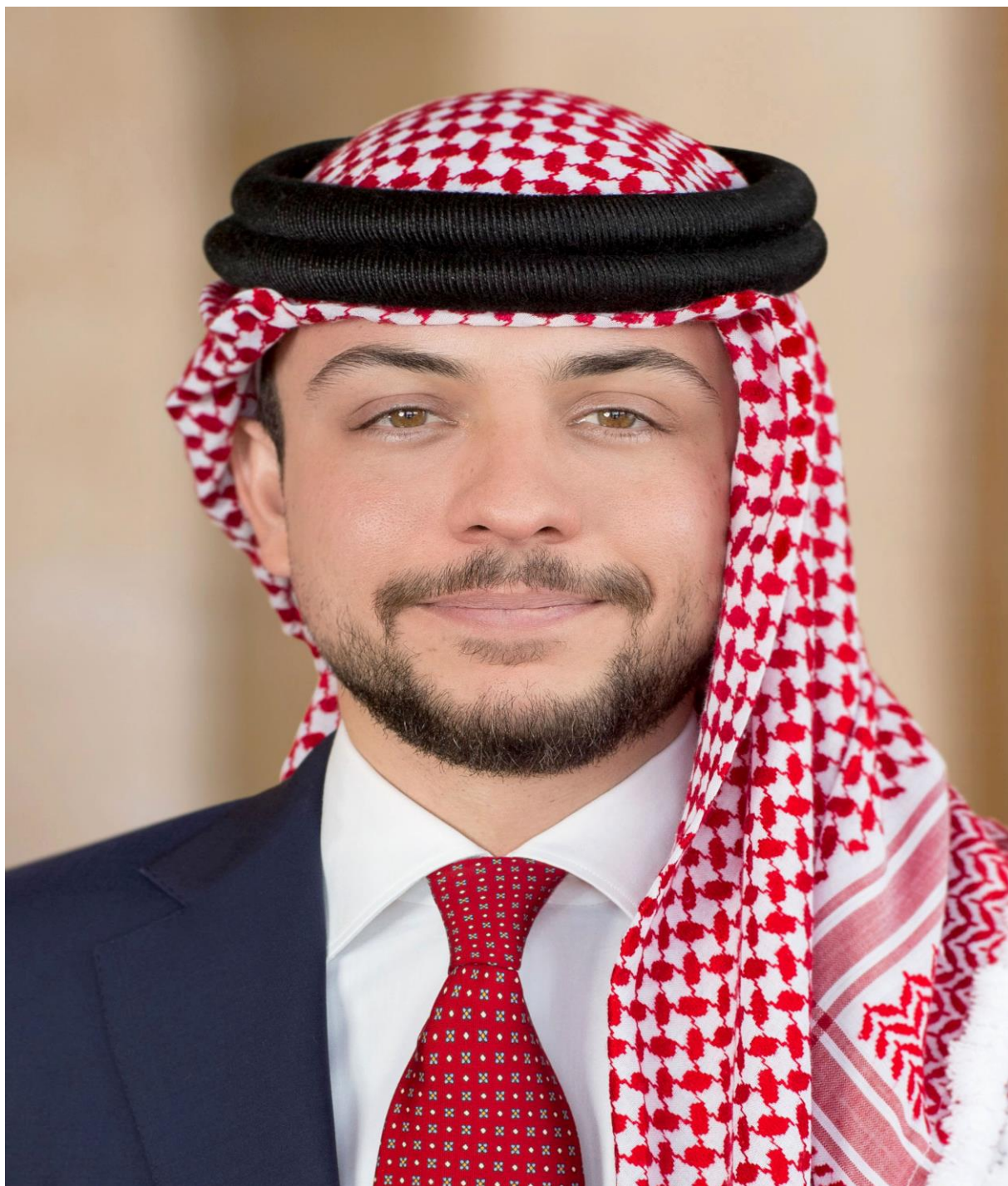
حضرة صاحب السمو الملكي الأمير الحسين بن عبد الله الثاني