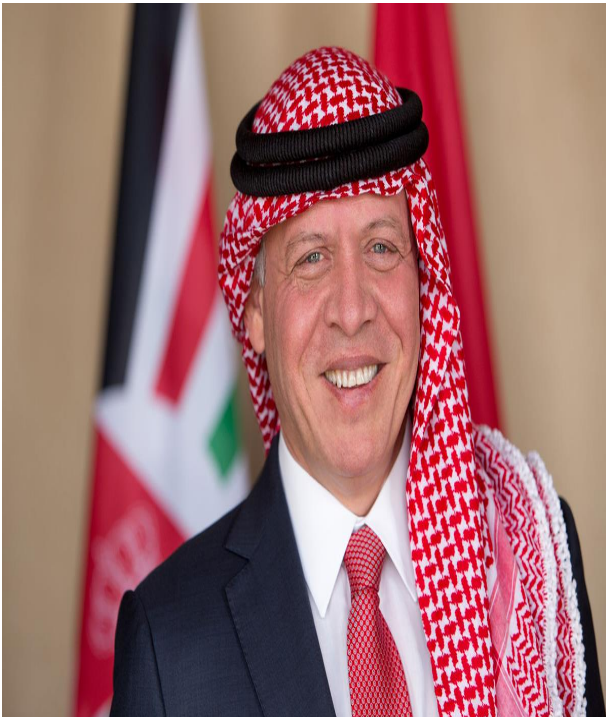
حضرة صاحب الجلالة الملك عبد الله الثاني بن الحسين المعظم